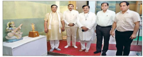
हिसार। सेमिनार का उद्घाटन करते मुख्यातिथि एवं हरियाणा के स्वास्थ्य एवं नागरिक उड्डयन मंत्री डा. कमल गुप्ता।

हरियाणा के स्वास्थ्य एवं नागरिक उड्डयन मंत्री डा. कमल गुप्ता ने कहा है कि किसी भी राज्य के विकास के लिए कनेक्टिविटी व टूरिज्म सबसे अधिक महत्वपूर्ण हैं। यदि हरियाणा को विकसित राज्य बनाना है तो इन दोनों बिंदुओं पर सर्वाधिक काम करना होगा। राज्य सरकार इस दिशा में तेजी से कार्य कर रही है। हिसार में बना महाराजा अग्रसेन अंतर्राष्ट्रीय हवाई अड्डा प्रदेश के मध्य भागों से राष्ट्रीय तथा अंतर्राष्ट्रीय कनेक्टिविटी बढ़ाने का सार्थक प्रयास है। डॉ. कमल गुप्ता गुल्वर को गुरु जम्भेश्वर विज्ञान एवं प्रौद्योगिकी विश्वविद्यालय के अर्थशास्त्र विभाग के सौजन्य से ‘विकसित हरियाणा-2034’ विषय पर आयोजित राष्ट्रीय सेमिनार को